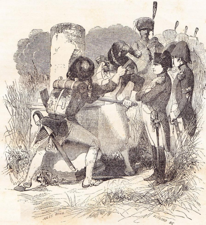
Napoléon fait abattre par des sapeurs la colonne de Rosbach. (Chap. VI.)

main, au point du jour, Napoléon les conduisit sur la plage et mit quelques pièces de canon à leur disposition. Étonnés de se voir entièrement à découvert, ceux-ci demandèrent s'il n'y avait pas quelque abri, quelque épaulement. Le commandant leur répondit très-sérieusement que cette méthode était bonne autrefois, mais que maintenant ces précautions n'étaient plus de mode, et que le patriotisme avait rayé tout cela. Pendant ce colloque une frégate anglaise vint à lâcher une bordée; la plupart des nouveaux venus ne jugèrent pas prudent d'en attendre davantage: les uns disparurent du quartier-général, et les autres s'incorporèrent modestement dans le train d'équipages.